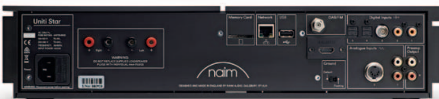
SACHLICH, SINNVOLL: Auch der Rücken wirkt edel reduziert. Für die Lautsprecherkabel braucht es Stecker, doch es geht auch unsichtbar per WLAN hinein – bei 2,4 und 5 Gigahertz.