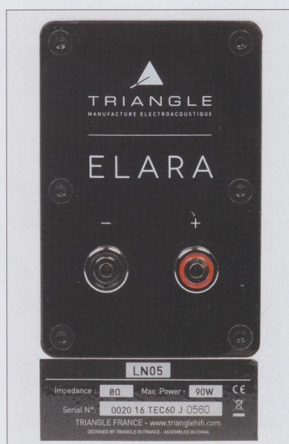
Gut zu erkennen: die Impedanz ist mit 8 Ohm angegeben