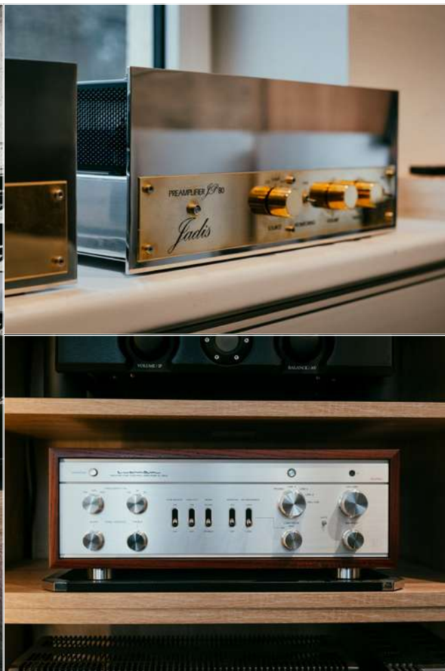
Einzelkomponenten oder Kompaktsysteme: Auf 100 Quadratmetern gibt es eine breite Auswahl an ausgesuchten Marken.

gefertigter Plattenspieler von „Dr. Christian Feickert“ aus March-Buchheim, Phonovorverstärker von der Blue Amp Manufaktur in Reute, Lautsprecher von Gauder Akustik aus dem schwäbischen Renningen oder die legendären Revox-Bandmaschinen, produziert in Villingen.